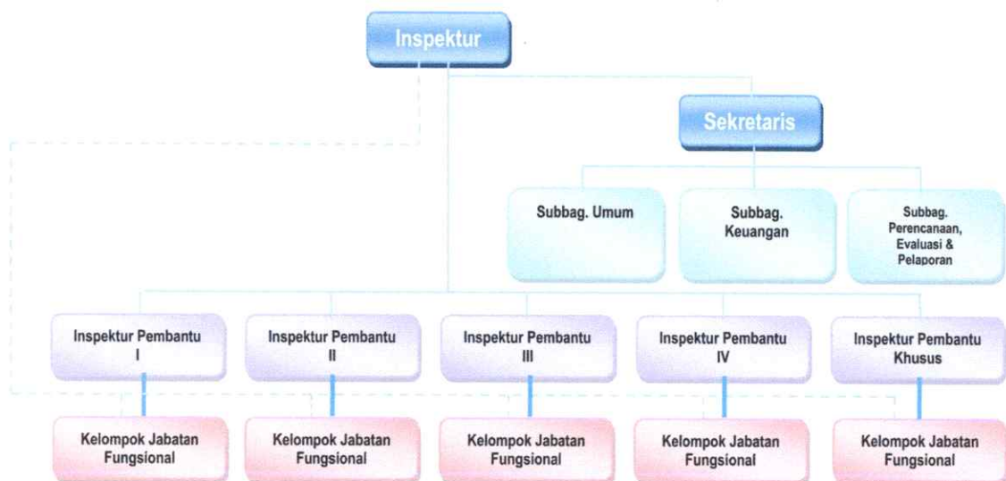
Gambar 1.1. Struktur Organisasi Inspektorat Provsu

Struktur Organisasi Inspektorat berdasarkan Peraturan Gubernur Sumatera Utara Nomor 28 tahun 2023 tentang Tugas, Fungsi, Uraian Tugas dan Tata Kerja Perangkat Daerah Provinsi Sumatera Utara digambarkan sebagai berikut: